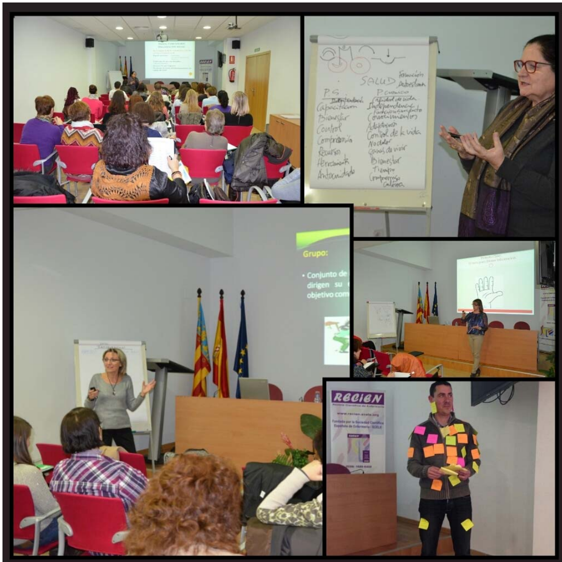
Atentamente, Grupo de Docencia e Investigación de SCELE.