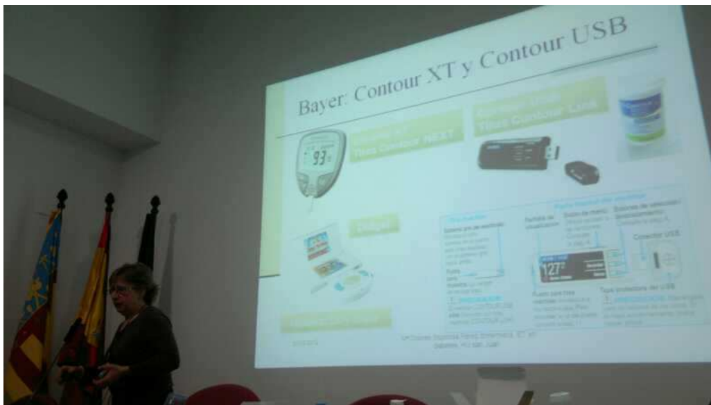
Imagen de la exposición de Dña. M a Dolores Espinosa

Atentamente, Grupo de Docencia e Investigación de SCELE.